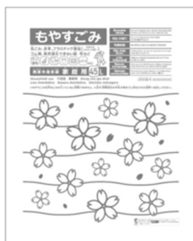
もやすごみ専用指定袋